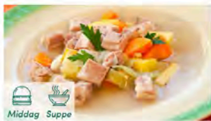
Betasuppe med pinnekjøtt