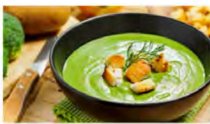
Potet- og brokkolisuppe

Skriv for eksempel 'grønnsaker', 'tomat', 'fisk' eller 'kjøtt'