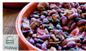
Feijoada- Brasils nasjonalresterett!